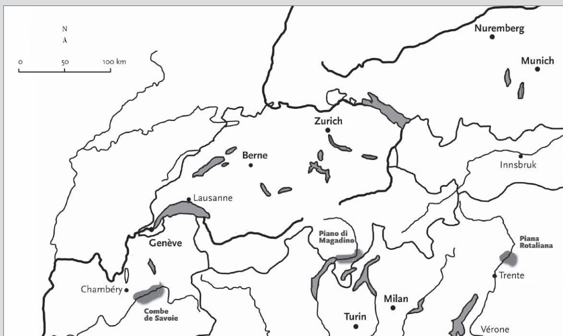
Figure 1. Localisation de la vallée de l'Isère (combe de Savoie), de la plaine de Magadino (Tessin) et de la Piana Rotaliana (Trentin).

Carte : L. Lorenzetti.